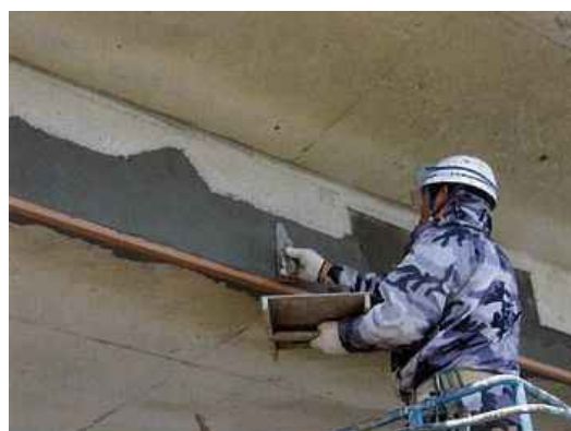
写真 4－3 断面修復状況