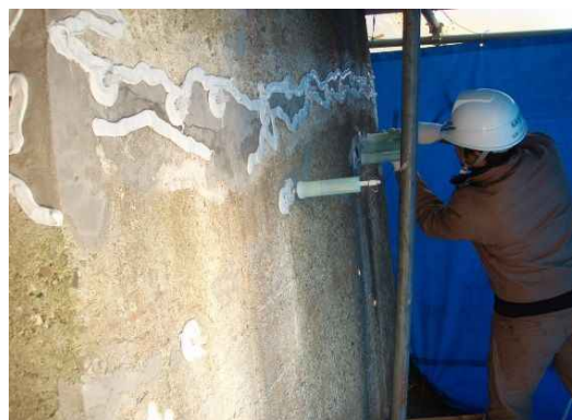
写真 4－2 ひび割れ注入状況

ひび割れを塞ぐことにより、劣化因子（水分、塩化物など）の侵入を防止し、コンクリートの耐久性を向上することができます。