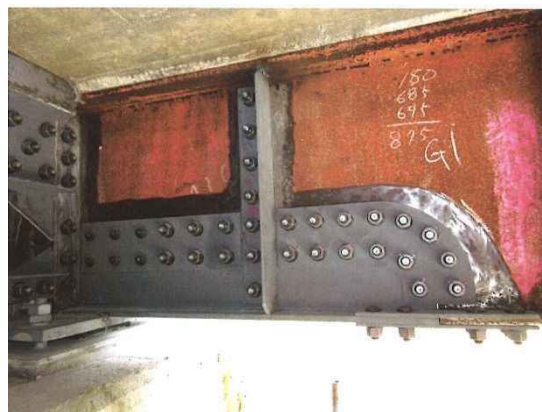
写真 4－1 当て板工実施状況